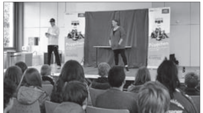
Foto: Die AOK Schwarzwald-Baar-Heuberg und der Landkreis Tuttlingen starten eine Präventionsaktion gegen Essstörungen. Im Bild eine Aufführung des Theaterstücks „Püppchen“ an der Eichendorffschule Donaueschingen 2017.

Der Landkreis und AOK weisen darauf hin, dass die Kampagne für Kinder und Jugendliche beiderlei Geschlechts wichtig und sinnvoll ist. Während von Magersucht vor allem Mädchen und junge Frauen betroffen sind, seien bei anderen Formen der Essstörungen über ein Viertel der Betroffenen Jungen bzw. Männer.