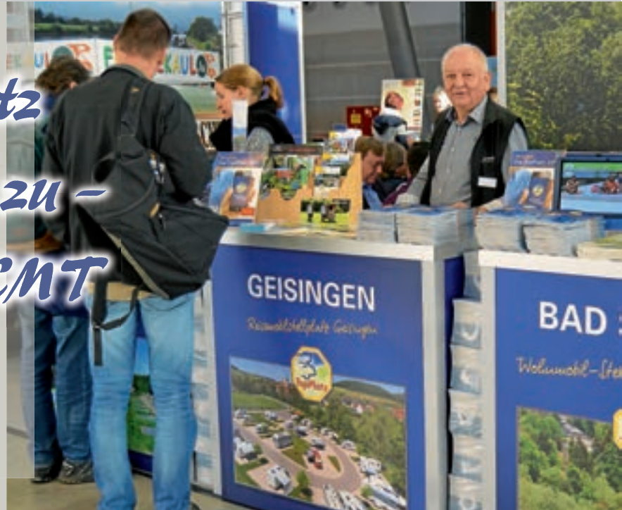
Reisemobilstellplatz Übernachtungen (Anzahl der Reisemobile)

Die CMT in Stuttgart gilt als beste deutsche Reisemesse. 260.000 Besucher informierten sich vom 12. bis 20. Januar über die Reiseziele im In- und Ausland.