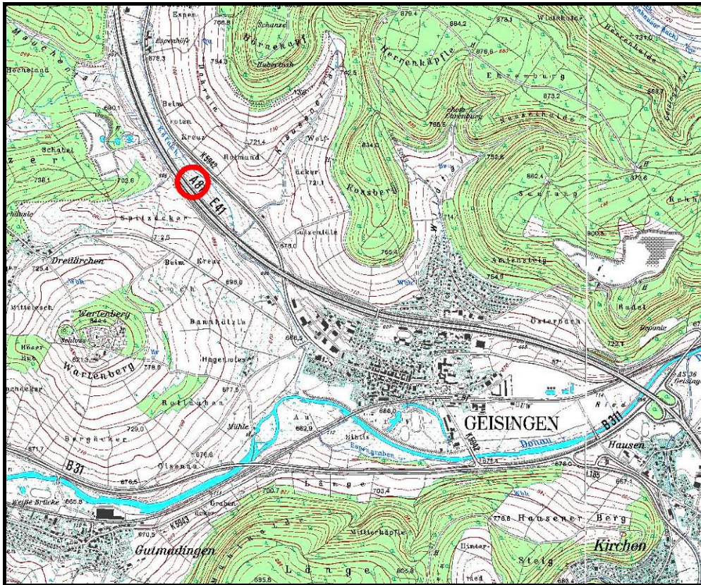
Abb.1: Übersichtslageplan (unmaßstäblich)

(Geobasisdaten © Landesamt für Geoinformation und Landentwicklung Baden-Württemberg, www.lgl-bw.de , Az.: 2851.9-1/19)