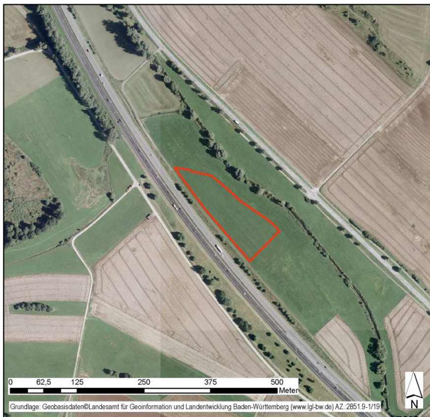
Abb. 2: Luftbild des Vorhabenbereichs

Das derzeit als Grünland genutzte Flurstück liegt zwischen der Autobahn A 81, die auf der Westseite entlangführt, und der Kötachau im Osten. Das Plangebiet ist schwach nach Nordosten in Richtung Kötachau geneigt. Zur A 81 besteht eine Einschnittsböschung.