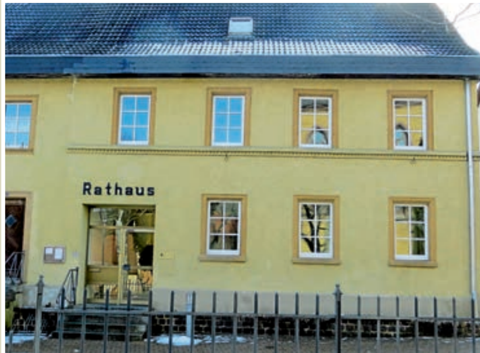
Außenansicht des Rathauses mit den neuen Fenstern

Zudem werden in den nächsten Tagen neue Eingangstüren am Gebäude einbaut. In diesem Jahr sind im Haushalt noch Mittel für die Sanierung des Daches eingestellt.