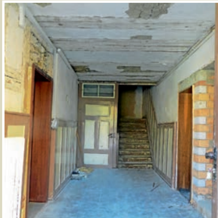
Sanierungsarbeiten im Flur haben begonnen