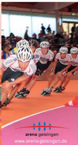
arena geisingen www.arena-geisingen.de