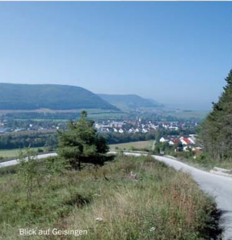
Blick auf Geisingen